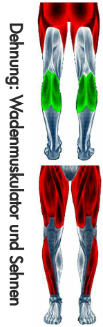
Dehnung: Wadenmuskulatur und Sehnen