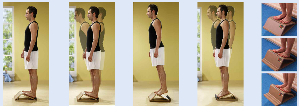
1. Grundübung: Aufrecht stehen 2. Pendelübung 3. Streckübung 4. Talübung Schwierigkeitsstufen